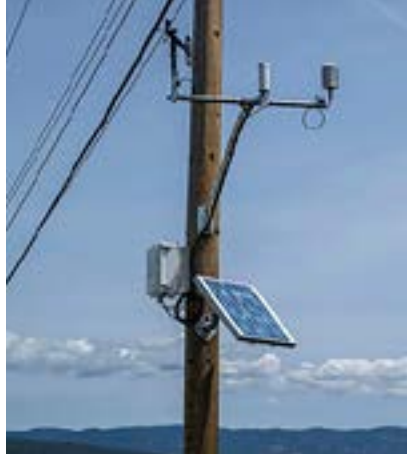
मौसम स्टेशन ज़्यादा विस्तृत और स्थानीय डेटा जमा करते हैं।