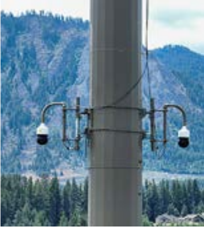
Pano AI स्मोक-डिटेक्ट करने वाले कैमरे आग बुझाने में मदद करते हैं।